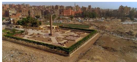
Musée en plein