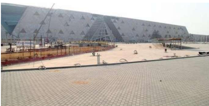
Photo du Chantier 2019

« Il aura mis tellement de temps à sortir des sables que l'on s'est parfois demandé s'il ne s'agissait pas d'un mirage. Tout est si démesuré : près de trente années de travaux, une facture dépassant le milliard de dollars (contre les 800 millions de départ), et plus de 5 000 ouvriers qui s'activent chaque jour à Gizeh , en contrebas des pyramides, pour bâtir un des plus fabuleux musées de la planète. Baptisé GEM (Grand Egyptian Museum), il doit abriter 100 000 œuvres et présenter pour la première fois, depuis sa découverte en 1922, la totalité du trésor de Toutankhamon. » Paris Match