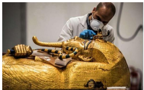
Restauration du sarcophage extérieur en bois doré de Toutankhamon.